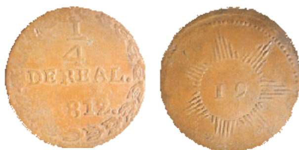
Cuartillo patriota de 1812

Me refiero a las emisiones independientes de Venezuela acuñadas durante un breve lapso en 1812, bajo la administración del Gobierno Patriota de la Primera República (1810-1812).