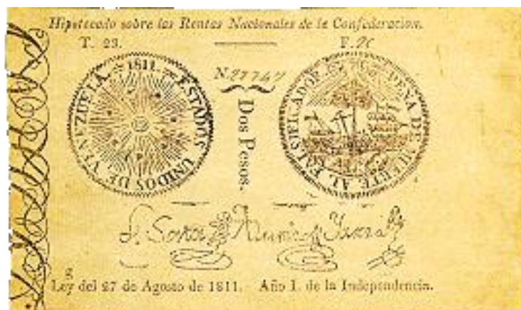
2 pesos Ley del 27 de agosto de 1811

Pero no sólo en las monedas aparece el sol: también se emitieron billetes con este símbolo en 1811. Según lo establece la disposición 3ª de la Ley del 27 de agosto de ese año, los billetes «contendrán el sello de la Confederación, la inscripción Estados Unidos de Venezuela, y su valor particular ». Se imprimieron en varios valores y en diferentes emisiones. Aquí podemos ver un ejemplar de 2 y uno de 4 pesos. Un interesante y muy completo estudio de estos billetes lo podemos encontrar en “El Papel Moneda en la Primera República”, de Tomás F. Stohr, Banco Central de Venezuela, 1999.