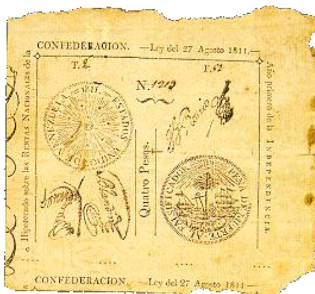
4 pesos Ley del 27 de agosto de 1811

Aquí presento una reproducción ampliada del sello de los billetes que ordena la ley, que muestra el sol con el 19 en el centro, cubriendo con sus rayos todo el campo. Entre éstos se hayan repartidas siete estrellas, correspondientes a las siete provincias que se unieron para proclamar su soberanía. Este diseño es similar al que aparece en el encabezado de El Publicista de Venezuela preparado por Juan José Franco, oriundo de Cumaná. Por el volumen de trabajo, fue necesario preparar más de un juego de sellos y diferentes galeras con los textos, por lo que es posible detectar ciertos cambios en el diseño, dando lugar a variedades en los billetes de una misma denominación, en lo que a