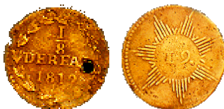
Octavo patriota de 1812

Son piezas de cobre, de \frac{1}{4} y \frac{1}{8} de real, en una de sus caras (que no podemos precisar si se trata o no del anverso, pues las fuentes consultadas se contradicen) contienen el valor y la fecha rodeados por una orla de laurel, con gráfila perlada y en la otra –la que nos interesa– aparece una imagen que parece un sol, en cuyo centro se encuentra la cifra “19.”, es decir, “19” (lo que es lógico, pues el 19 de abril de 1810 fue el comienzo del primer gobierno patriota), y cuyos rayos (de diferente longitud) se encuentran agrupados en haces (como las piezas de Córdoba de la época de los concesionarios). Éstos son 7, el mismo número de las provincias que se habían unido, (aunque esto es sólo una suposición, pues no encontré bibliografía al respecto). Todo está rodeado de una gráfila de perlas.