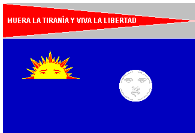
Representación de la bandera naval de Miranda

Además existe otra bandera venezolana con un Sol, que fue creada originalmente por el Generalísimo Francisco Miranda (1750-1816). Data de 1806, fecha de la invasión de Miranda a las orillas de Coro, Venezuela. A comienzos de ese año, Miranda partió de Nueva York en las naves (qué él fletó) "Leander", "Bachus" y "Biee", en un esfuerzo por capturar Coro y conquistar otras ciudades costeras venezolanas. La invasión falló ensordecedoramente. Esta bandera es conocida como la bandera naval de la Leander. Aunque flameó en el mástil de la corbeta "Leander", y nunca se usó subsecuentemente, no fue necesariamente considerada una bandera. Todavía su forma sugiere el hecho de que él tenía un proyecto para una bandera militar en esa invasión (sin embargo, las banderas originales fueron quemadas por las autoridades coloniales). La bandera era un campo rectangular azul oscuro con las figuras de un sol naciente en oro (el diseño sugiere que el sol está surgiendo sobre el horizonte) y una luna llena en plata, ambos figurados. El sol representa el alba de una nueva era, el comienzo de la naciente libertad americana que se alza sobre el horizonte y la luna llena es un símbolo de la decadencia del poderío español en América (otras versiones dicen que representa la luz en la oscuridad, pero la primera es la más aceptada) El campo azul es el cielo y el mar. Sobre la bandera encontramos un gallardete rojo con el grito de guerra "MUERA LA TIRANÍA Y VIVA LA LIBERTAD"