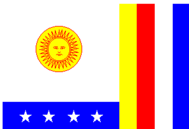
Representación de la bandera de Gual y España

Existen muchas representaciones diversas de esta bandera, tantas como fuentes hay de información, pero todas conservan el mismo diseño, variando fundamentalmente en el dibujo del sol.