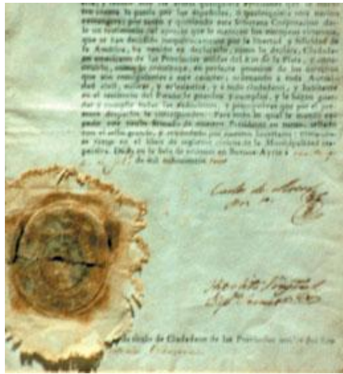
Fig.2 Fragmento de la carta de ciudadanía de Antonio de Olavarría