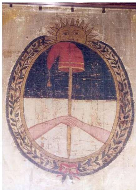
Fig.3 Bandera que Belgrano obsequió al Cabildo de Jujuy