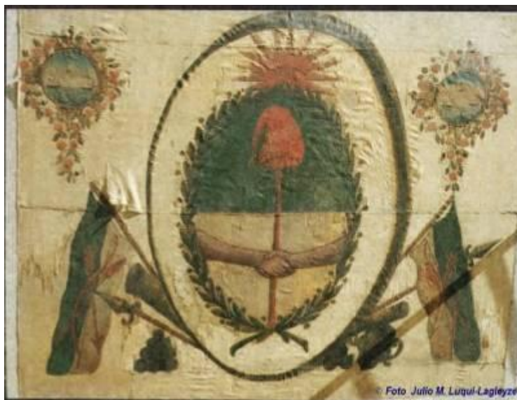
Fig.9 Bandera del Regimiento N°7 de Infantería

luchaban por su independencia» 14 . Según los autores citados, esta bandera se corresponde con la descripción que efectúa el jefe del Regimiento N°7, teniente coronel Toribio de Luzuriaga, en noviembre de 1813: "Siendo tiempo de formarse las banderas del batallón a mi cargo, espero las ordenes de V.E. sobre las armas que deben ponerse, pareciéndome proponer podrían ser las de la Soberana Asamblea General Constituyente, y las de Buenos Aires, con símbolos de la luz y América del Sur, en los cuatro ángulos" 15 , y ello permitiría atribuirle a tal unidad. Esta bandera dataría, siempre según los mencionados autores, de finales de 1813.