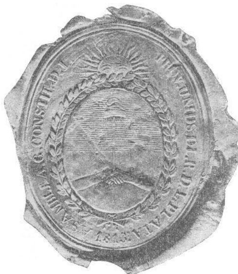
Fig.1 Sello en lacre de la Asamblea