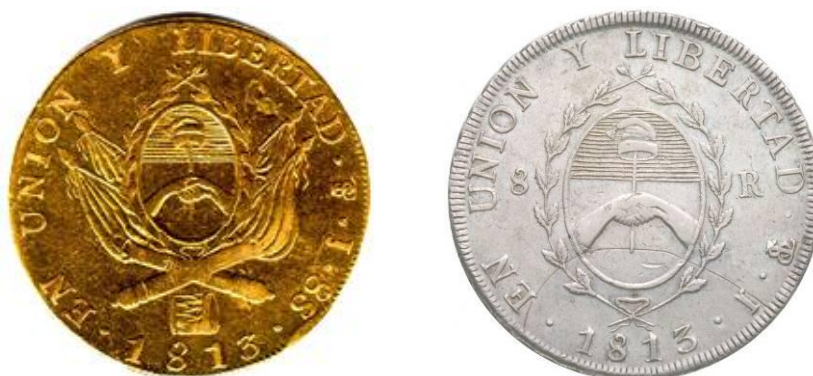
Fig.7 Monedas acuñadas en Potosí con el sello de la Asamblea