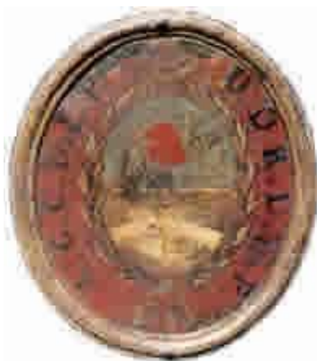
Fig.8 Escudo que según la tradición estuvo colocado en la puerta del Consulado