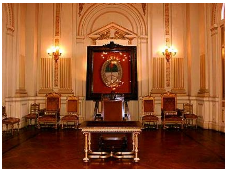
Fig.5 Salón de la Bandera de la Casa de Gobierno de Jujuy