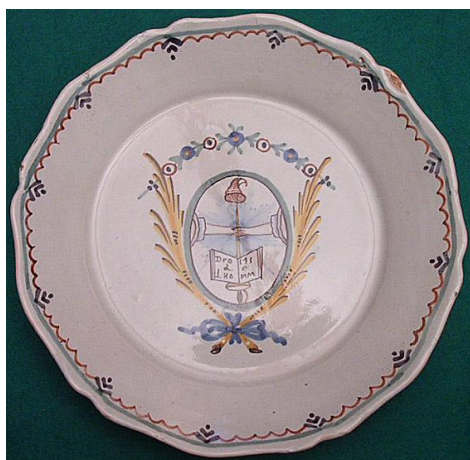
Fig.6 – Plato de loza decorado (c. 1789-1790)

Pero esto no termina aquí. Entre la gran cantidad de platos de loza decorados en Francia a finales del siglo XVIII, encontramos estos, que presentamos como Figs. 6 y 7.