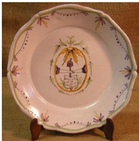
Fig.7 – Plato de loza decorado (c. 1789-1790)

En este plato podemos observar una elipse, en la que dos brazos derechos vestidos se estrechan sobre una espada que sostiene un gorro frigio, y sobre cuya empuñadura se asienta un libro abierto con la inscripción, en tres líneas, “DROITS / DE / L’HOMM”; a ambos lados de la elipse, dos ramas de palma unidas en la parte inferior con una cinta azul.