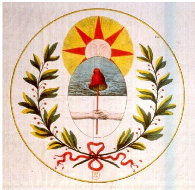
Fig.3 – Emblema revolucionario francés c.1790-1793