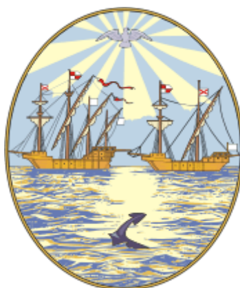
Fig.1 – Escudo de la ciudad de Buenos Aires

Una de las hipótesis tradicionales sobre el origen del sello de la Asamblea es la que plantea la utilización del campo y esmaltes del escudo de la ciudad de Buenos Aires 1 (Fig.1), es decir, una elipse cortada en dos, de azur y plata, con el reemplazo de sus elementos. Ilustra Corvalán Mendilaharzu esta teoría citando a Roberts, quien afirma que el autor del sello: «tomó como base el sello de Buenos Aires borrando los símbolos de la ciudad de la Trinidad y de su puerto, quedando entonces el escudo liso, la parte inferior un Río de la Plata, emblema exacto del nombre del país y la parte superior naturalmente un cielo azul. Después colocó en él los símbolos de la nueva Nación...» 2 . También Rosa sostiene: «los colores que sirven de fondo son los mismos del escudo de Buenos Aires (donde el plata representa al río epónimo y el azur al cielo donde está la paloma del Espíritu Santo)», y nos dice que el artista «tomó el escudo de Buenos Aires, quitó los símbolos de la ciudad y puerto (naves, ancla y paloma) y los cambió por otro que se refería a las nacientes Provincias Unidas» 3 .