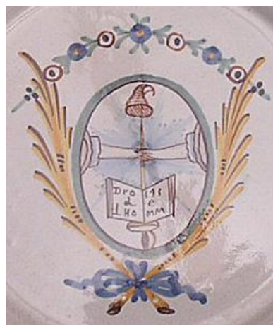
Fig.6.1 – Detalle del plato