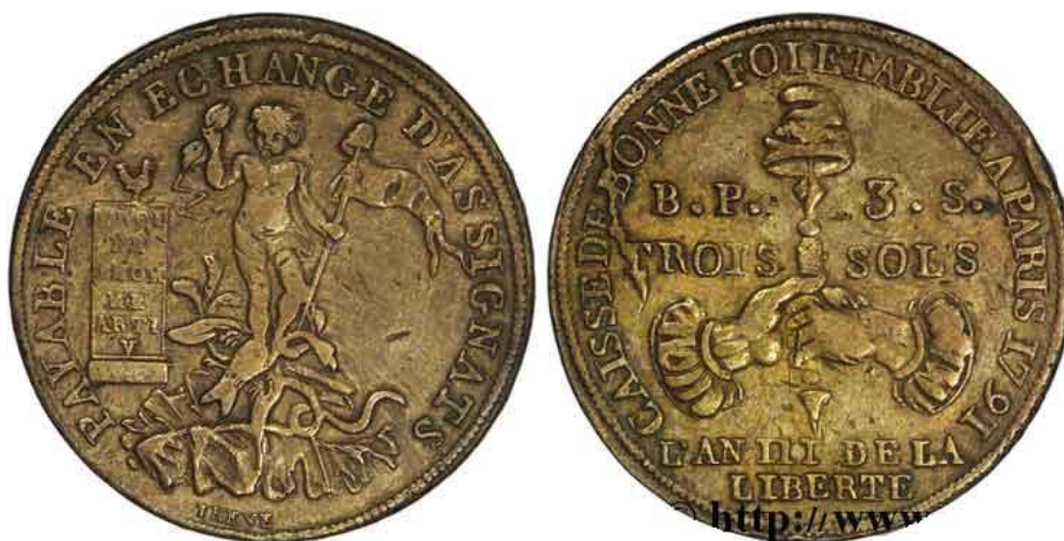
Fig.5 – 3 Sols de cobre, 1791

Declaración de los Derechos del Hombre y el Ciudadano 11 . Sobre la cinta, y a ambos lados de las picas, el valor “2 S / 6 D / B. P. SIX / BLANCS”, es decir, “2 Sols 6 Deniers bueno por 6 Blancs”. Todo rodeado por la leyenda “CAISSE DE BONNE FOY ETABLIE A PARIS”, y en el exergo, 1791. Estas piezas son conocidas como “Six blancs de Montagny”, por el nombre del grabador del busto de Minerva del anverso.