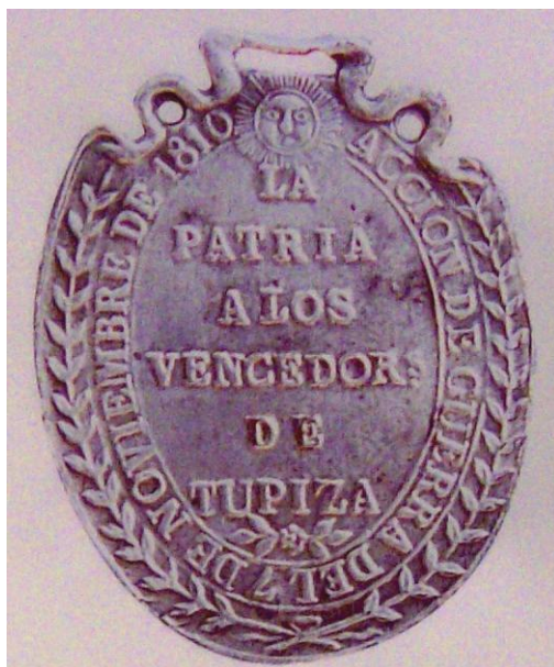
Fig.2 – Medalla de Tupiza

batalla de Tupiza o Suipacha, primer gran triunfo de las armas patrias, el 7 de noviembre de 1810. La medalla es de forma oval, y ostenta, entre otros elementos, dos ramas de laurel que se entrecruzan en la parte inferior atadas por una cinta y timbradas por un sol radiante, elementos que, como sabemos, también existen en el escudo nacional.