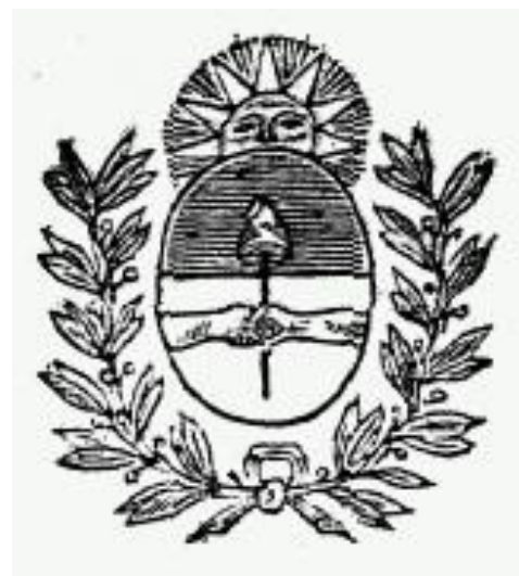
Fig.12 – Comparación entre el emblema jacobino y el escudo de la Constitución de 1826