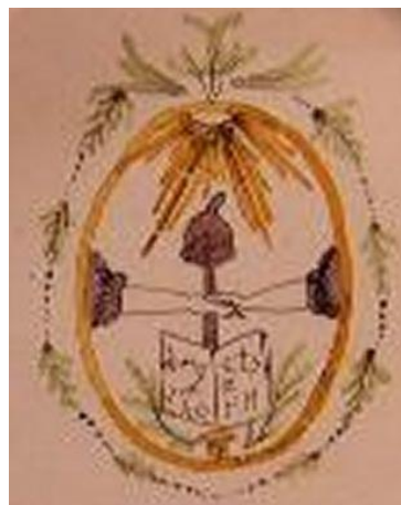
Fig.7.1 – Detalle del plato

En este plato apreciamos una elipse, en la que dos brazos derechos vestidos se estrechan sobre una espada que sostiene un gorro frigio, en cuya empuñadura, y sobre dos ramas de palma, se asienta un libro abierto con la inscripción, en tres líneas, “DROITS / DE / L’HOMM”; en el jefe, rayos de luz. Rodea la elipse una guirnalda de una planta que no es posible identificar.