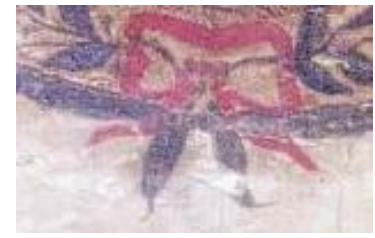
Fig.10 – Cintas que unen los laureles en ambos emblemas. Son de color rojo

Pero las “coincidencias” no terminan aquí. Si observamos la portada de la Constitución de 1826 (Fig.11), encontraremos otra sorpresa (Fig.11.1).