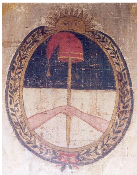
Fig.9 – Bandera que Belgrano obsequió al Cabildo de Jujuy, 1813

La primera tiene que ver con un análisis del emblema jacobino y su comparación con la más antigua representación en colores del sello de la Asamblea, esto es, la bandera que Belgrano regalara al Cabildo de Jujuy en mayo de 1813 (Fig.9).