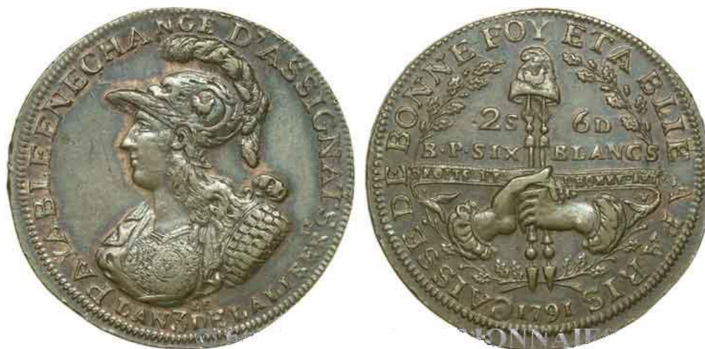
Fig.4 – 2 Sols 6 Deniers de cobre, 1791

Precisamente entre los emisores de estas “Monnaies de Confiance” encontramos a la “Caisse de Bonne Foi”, o “Caisse de Bonne Foy” (Caja de Buena Fe), establecida en París, que emitió dos fichas, de 2 Sols 6 Deniers (Fig.4) y de 3 Sols en cobre 9 (Fig.5), con fecha 1791. Lamentablemente no disponemos de más información que la que brindan las mismas fichas, cuya descripción, en lo pertinente, realizaremos a continuación.